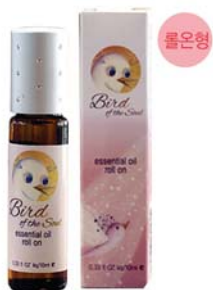
영혼의 새 에센셜 오일