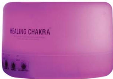
[HSP] 힐링차크라 LED램프 디퓨저