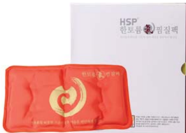
[한토름] 기(氣)찜질팩 38,000원 → 33,000원