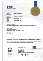
황칠나무 추출 발효물을 유효성분으로 함유하는 육모제 조성물