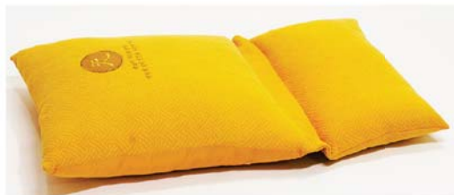
HSP 2단 절방석 79,000원 • 60cm X 104cm X 18cm • 국내산 100% 목화솜 / 접이식