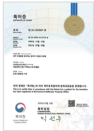
생약 추출물을 함유하는 알리지 개선용 조성물