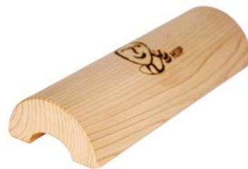
HSP 적삼경침 (길이 28cm) • 높이 7.0cm 17,000원