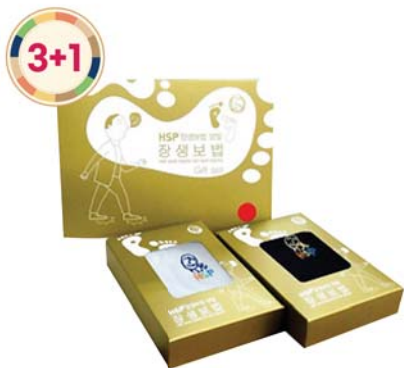
HSP 장생보법 양말세트 8,600원 • 여성용 / 롱밴드, 아이보리 남색 2족