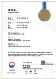
황칠나무의 추출물을 포함하는 조성물