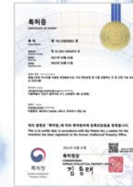
황칠나무와 미나리를 이용한 천연발효식초, 이의 제조방법 및 이를 포함하는 간 및 신장 기능 보호, 개선 건강식품