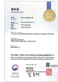
간 및 신장 기능 개선용 황칠계 복합 추출물