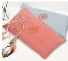
[한토름] 기찬 숙면 베개 140,000원 • 편안한 목 / 한토름볼 6kg