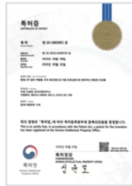
황칠나무 발효 추출물, 제조방법, 유효성분으로 함유하는 화장료 조성물