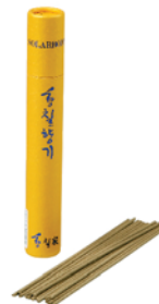
[황칠가] 황칠향기 미니