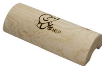
HSP 편백경침 (길이 28cm) • 높이 6.0cm / 6.5cm 16,000원 • 높이 7.0cm 19,000원