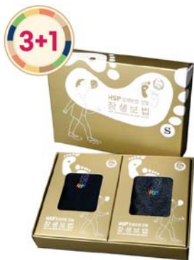
HSP 장생보법 양말세트 9,000원 • 남성용 / 장목 또는 단목